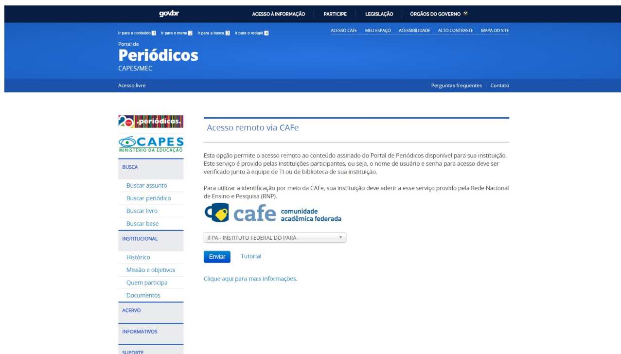
Figura 2: Escolha da instituição

Em seguida, na tela que será exibida, escolher a instituição. No caso, IFPA, conforme a figura 2. Deve-se escolher a instituição e, em seguida, clicar em “Enviar”.