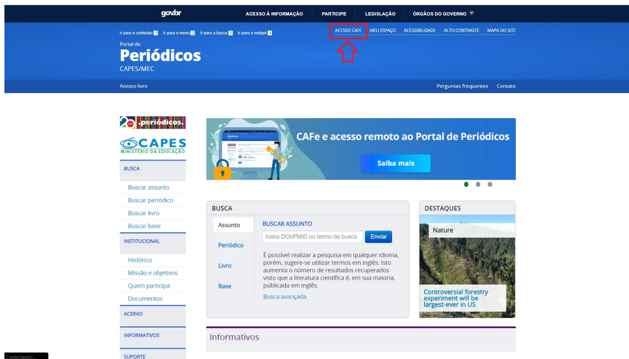
Figura 1: Acesso Cafe

Ao acessar o site: https://www.periodicos.capes.gov.br e depois clicar no link “Acesso Cafe”, conforme a figura 1 exibe.